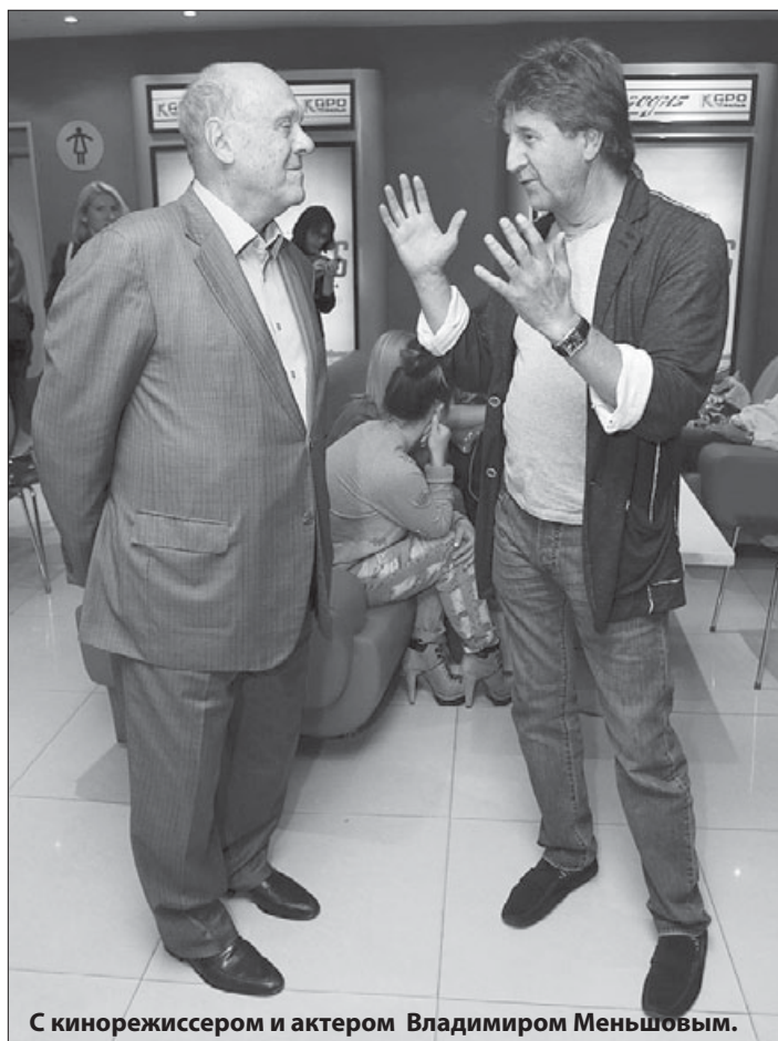
С кинорежиссером и актером Владимиром Меньшовым.