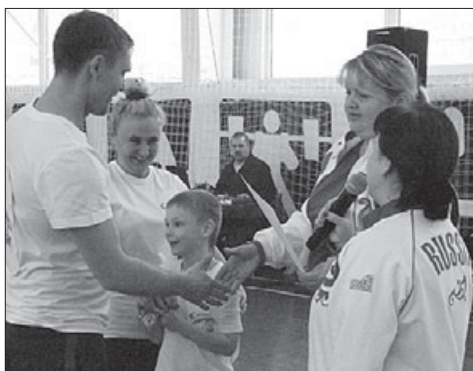
Фотографии из архива ДЮСШ № 1