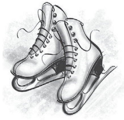
Рисунок из сети интернет